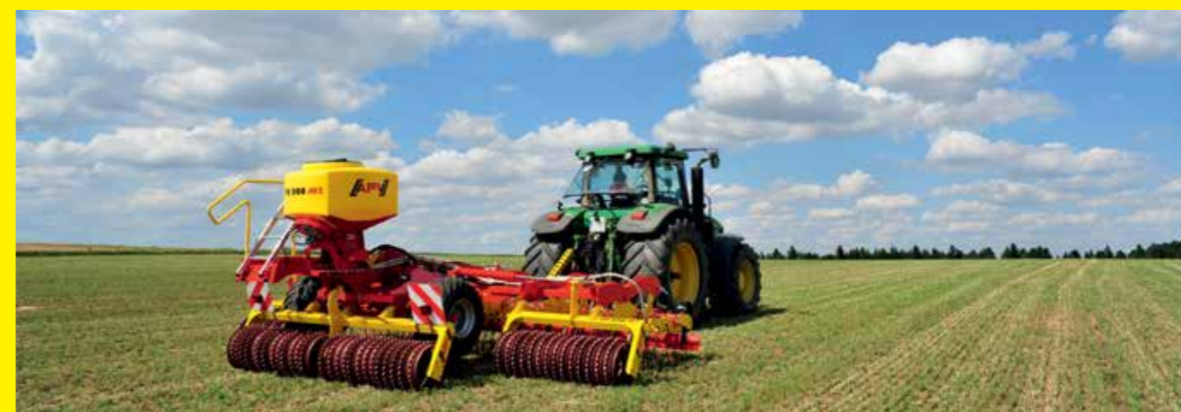
1 În combinație cu o semănătoare pneumatică PS de la APV